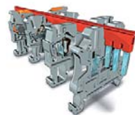
CLIPLINE Клеммные модули, принадлежности для монтажа и маркировки, инструмент