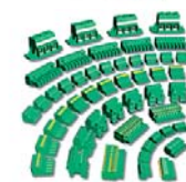
COMBICON Соединители для печатного монтажа и корпуса для электронных устройств