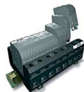
TRAVTECH Защита от импульсных перенапряжений