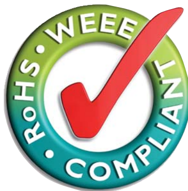
Рис. 4 Такую маркировку имеют все поставляемые компанией Phoenix Contact и совместимые с требованиями RoHS компоненты, например, коммутаторы SFN

SFN новой серии полностью удовлетворяют требованиям по снижению затрат на инфраструктурные компоненты.