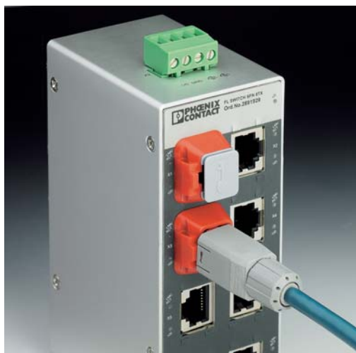
Рис. 3 Механически блокирующие устройства эффективно защищают от несанкционированного доступа используемые и неиспользуемые порты

Одна из ключевых функций защиты – предотвращение несанкционированного доступа к сетям. Для управляемого коммутатора 2-го уровня все функции защиты активируются программно, в то же время простые механически блокирующие устройства могут обеспечить одинаково эффективную защиту от несанкционированного или непреднамеренного доступа. Это означает, что порты RJ 45 полностью закрыты и подсоединенный патч-кабель не может быть отсоединен. С этой целью новые коммутаторы SFN оснащаются простыми пластмассовыми рамками (рис. 4). При этом вставленная заглушка или подсоединенный патч-кабель могут быть