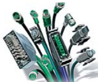
PLUSCON Промышленные разъемы и соединители