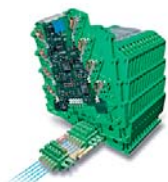
INTERFACE Преобразователи сигналов