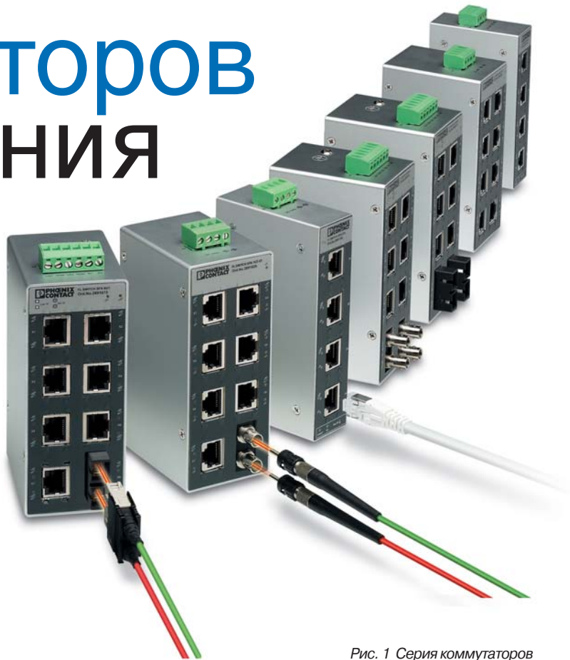
Рис. 1 Серия коммутаторов SFN, представленная 5- и 8-портовыми вариантами для сетей на базе медных или волоконно-оптических кабелей со скоростью передачи 10/100 Мбит/с и поддержкой гигабитного режима

функций обеспечения безопасности: контроль доступа, блокировка нежелательного трафика и предотвращение перехвата данных. Примеры: сегментирование сети с помощью коммутаторов, реализация виртуальных сетей VLAN (Virtual Local Area Network), специальные механизмы для многоадресной фильтрации или регулирование доступа путем блокировки портов (рис. 2). Чтобы активировать такие функции, коммутаторы должны быть соответствующим образом сконфигурированы. Для этой цели используются программные инструменты или система управления на базе сети Интернет - WBM (Web-Based Management). Но в любом случае для решения этих задач требуются специальные знания, а также тщательное предварительное проектирование сети. На практике эти условия часто не могут быть выполнены, поэтому функции безопасности в отношении устройств не реализуются.